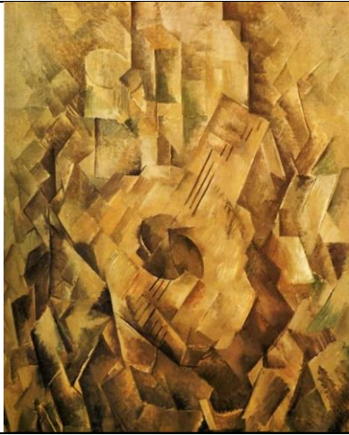
The Mandola van George Braque