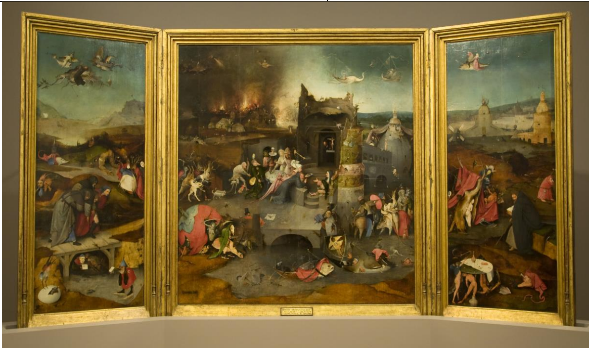
De verzoeking van de heilige Antonius van Jeroen Bosch